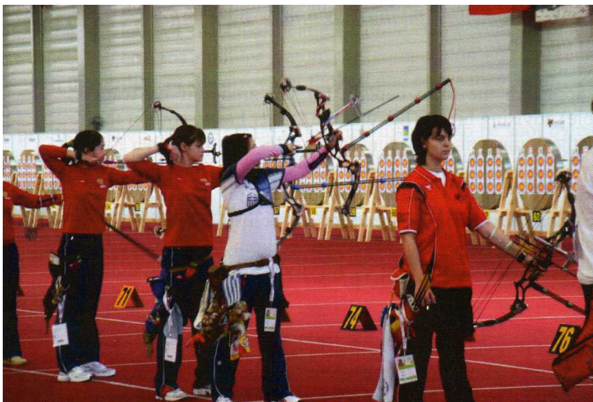
Armement par le haut ?

A tous moments, les arbitres doivent prendre en compte tous les aspects de la sécurité pendant la compétition.